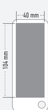
Druck im Satzspiegel trim