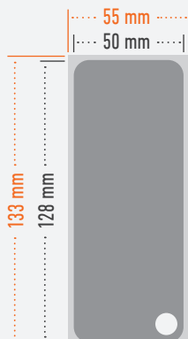
Druck im Anschnitt bleed